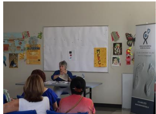
Conférence Bénévolat en contexte d'austérité