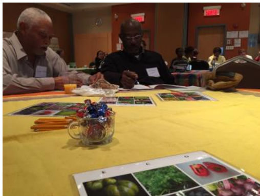
Journée réflexion Sécurité alimentaire