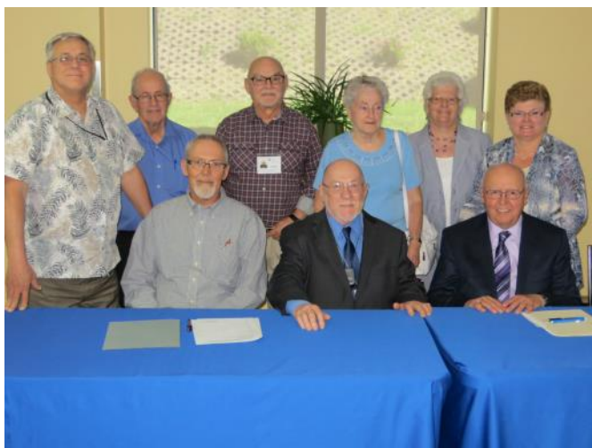
Membres actuels du Conseil d'administration

L'association québécoise de défense des droits des personnes retraitées et préretraitées de la Pointe-de-l'Île de Montréal (l'AQDR-PDÎ) compte neuf (9) administrateurs bénévoles sur son conseil d'administration et neuf (9) autres bénévoles impliqués dans les activités de l'organisme.