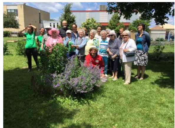
Sortie avec des aînés au Jardin Skawanoti

Nos engagements et notre implication dans la communauté de la Pointe Est de l'Île de Montréal sont uniquement rendus possibles grâce à la participation de notre équipe de bénévoles dévoués et très impliqués à la cause des Aînés.