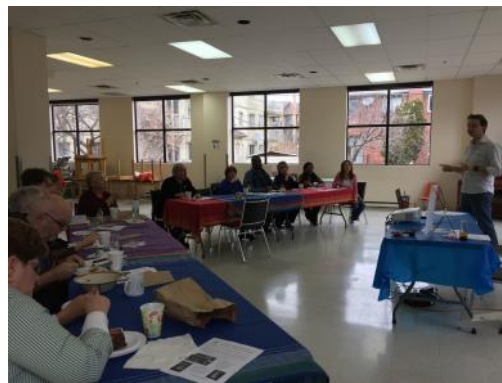
Retour sur la consultation bénévole