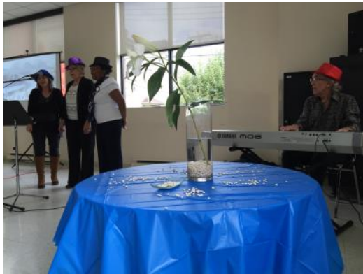
Dîner beans communautaire