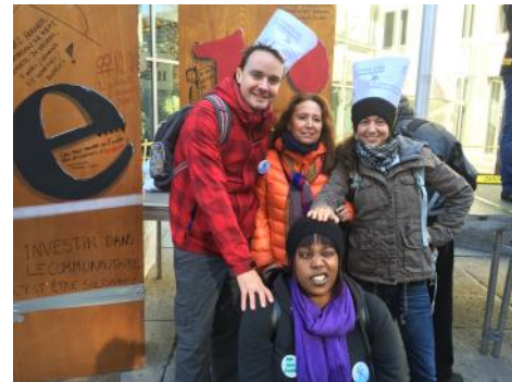
Manifestation 'Fermé pour cause d'austérité'